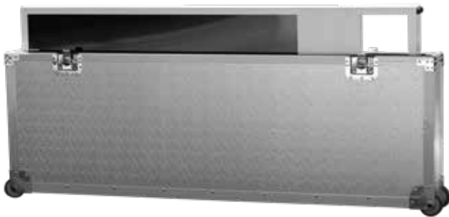
Flightcase / Verpackung