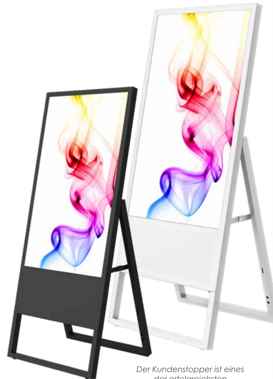
Der Kundenstopper ist eines der erfolgreichsten Werbedisplays am POS!

Die Art der Beschriftung hat sich geändert, die erfolgreiche Form des A-Ständers ist allerdings seit Jahrzehnten bis heute unverändert. Der digitale Kundenstopper steht da, wo Ihre Kunden hingehen oder wo Sie wollen, dass sie hingehen