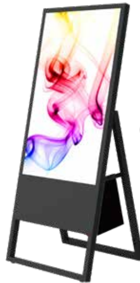
optional: Wiederaufladbare Batterie (für ca. 10 Stunden Laufzeit)